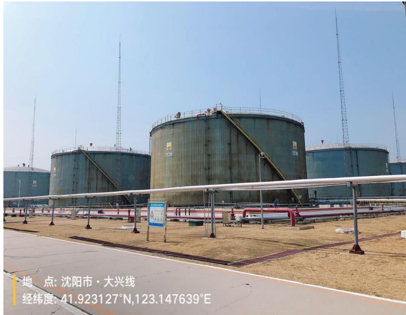
图 2-2 产品存储区域照片