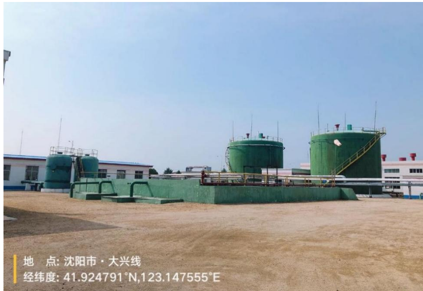
图 2-5 危废暂存区域照片

本地块排查重点区域 4 个，具体污染防治措施见表 2-3，各个识别区域位置见图 2-1。