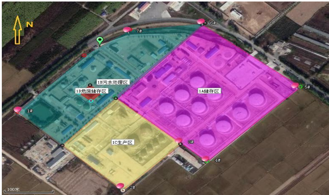
图2-1 沈一联合站地块疑似污染区域边界图