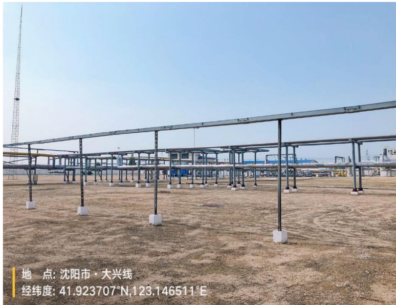
图 2-4 生产区域照片