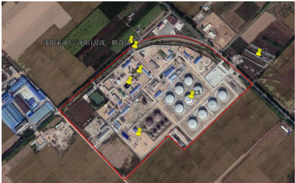
图 1-2 空间信息图（基础信息调查空间信息截图文件）