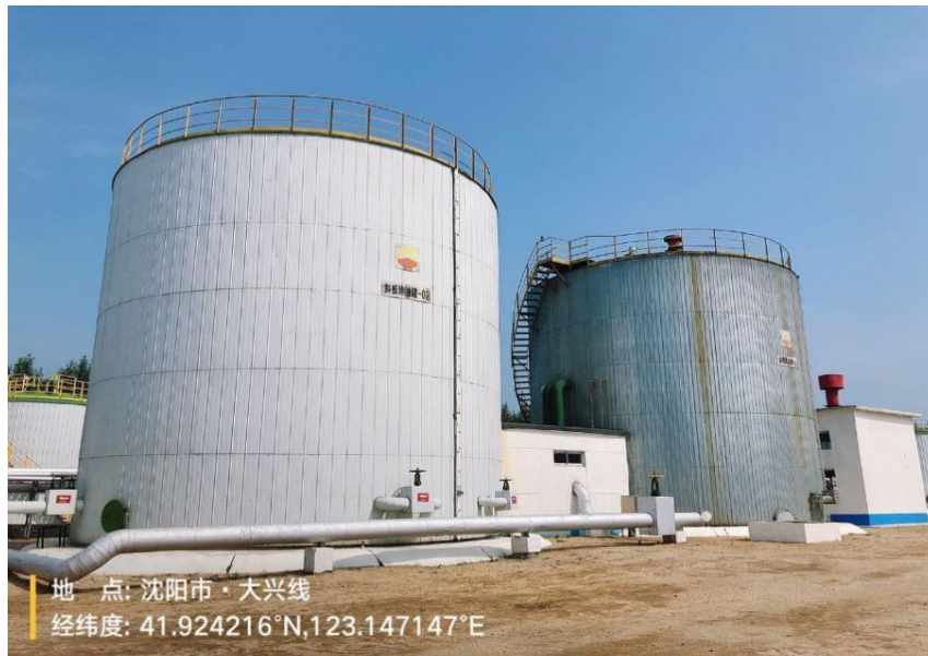
图 2-3 污水处理区域照片