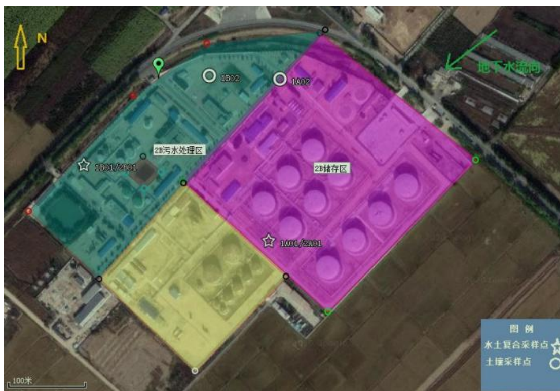
图 2-6 监测点位图