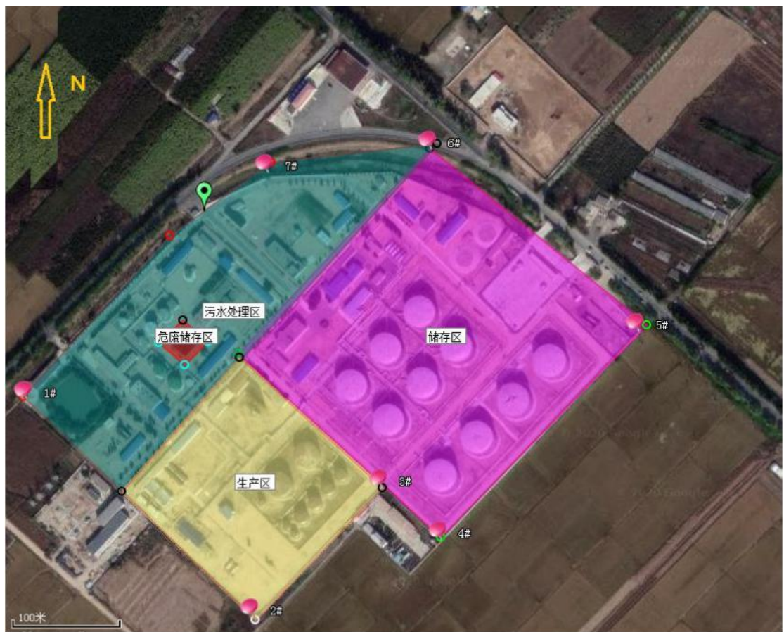
图 1-3 场地重点区域及平面布置图