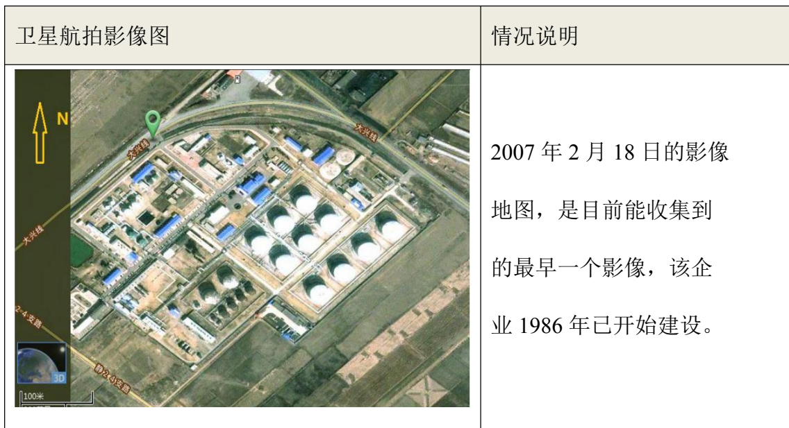
表 1-1 地块利用历史变更情况历史影像记录

经核实，地块利用历史与基础信息调查结果一致，核实后的地块利用历史见表 1-1 和表 1-2。