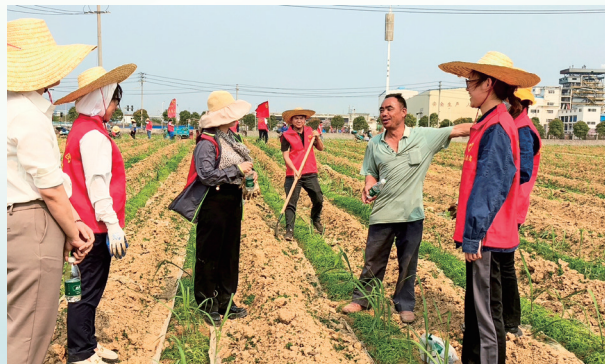
蔗农与贵糖志愿者亲切交流

下一步，贵糖集团党工团先锋队将深入贵糖蔗区的田间地头宣传良种良法，指导蔗农科学培土、施肥，引导蔗农防治病虫害，积极做好蔗地抗旱和