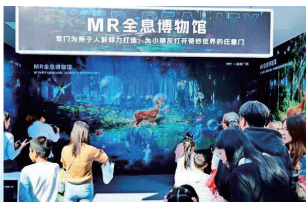
游客参加体验元宇宙 MR 全息博物馆