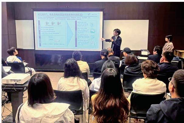
锅屋株式会社案例宣讲

雅马哈挂川工厂的参访犹如打开潘多拉魔盒，钢琴槌的羊毛筛选与摩托车曲轴锻造竟共享着同一套精密检测系统，从精选材料到精益生产，再到创新真空铸造技术，每一步都彰显了雅马哈对制造理念的极致追求，这是雅马哈的使命，也是其享誉