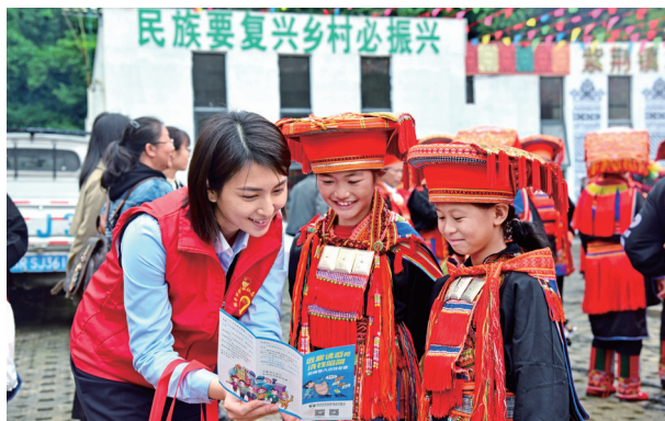
桂平联社组织志愿者深入少数民族地区开展“我为群众办实事——金融知识进瑶乡”宣传活动

大力弘扬民族精神、时代精神，赓续传承农信“挎包精神”等精神血脉，深入践行社会主义核心价值观，全面提升干部员工对中华优秀传统文化、