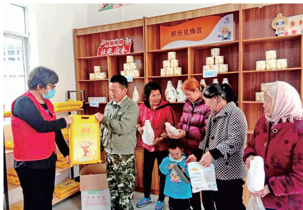
村民通过积分在爱心超市兑换产品

推动金融机构联合基层党组织制定信用积分评价管理办法，把广大群众信用表现、参与公益活动次数转化为具体积分，村党组织和银行每季度联合审核积分，组织积分兑换活动，提供洗洁精、抽纸等物质奖励，积分结果为基层党组织开展各类评先评优提供重要参考，也作为信贷评估依据，让按时履约成为文明的新风尚，实现新就业群体等人群的自我约束、自我管理、自我提高。比如，推行乡风治理积分制度，打造“爱心超市”26家，累计开展“爱心积分”兑换活动21场，共计13500分涉及376户。在南宁市西乡塘区金陵镇刚德村，桂林银行与刚德村委共同推进“积分制”，将“普惠信用”嵌入“道