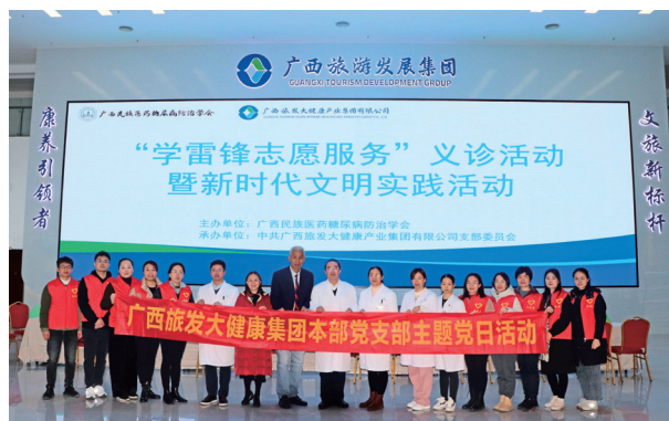
广旅大健康集团本部党支部开展“学雷锋志愿服务”义诊活动

大健康集团党委持续推进党风廉政建设,坚决扛起全面从严治党主体责任,将“清心养廉健康旅程”廉洁文化品牌建设融入“清廉广旅”建设、融入企业文化价值塑造,以风清气正干事创业的良好政治生态,作为公司企业生产经营的重要保障。一是压紧压实“廉”的责任。定期召开党风廉政建设工作会,坚持抓早、抓小、抓严、抓常、抓长,扎实推进“四责”联动。坚持将纪检监察全面覆盖公司全部在建项目和存量项目,紧盯选人用人、薪酬管理、财务监管、招标投标、物资采购等重点环节,以及资金密集、资源富集和资产聚集等重点领域以及人财物关键环节、岗位,做实做细日常监督,提升监督质量、压实“两个责任”。二是建立健全“廉”的机制。围绕“三重一大”决策、运营管理、财务管理、风险防控、医疗康养业务管理等方面修订一系列管理制度共80多项,逐步建立起符合大健康产业各业务板块经营管理要求的制度机制。把落实中央八项规定精神及实施细则作为长期有效的铁规矩、硬杠杠,一体推进不敢腐、不能腐、不想腐,构建“三不”机制,营造崇廉尚廉、拒腐防变的良好氛围。三是紧盯紧抓“廉”的重点。盯紧“关键少数”和重点部位、时段、节点,持续推进“大家一起找风险”专项行动,全面排查生产经营过程中的廉洁风险隐患140余项,逐一对症施治。坚持以问题为导向,针对巡视巡察、审计督查反馈问题,有针对性做好