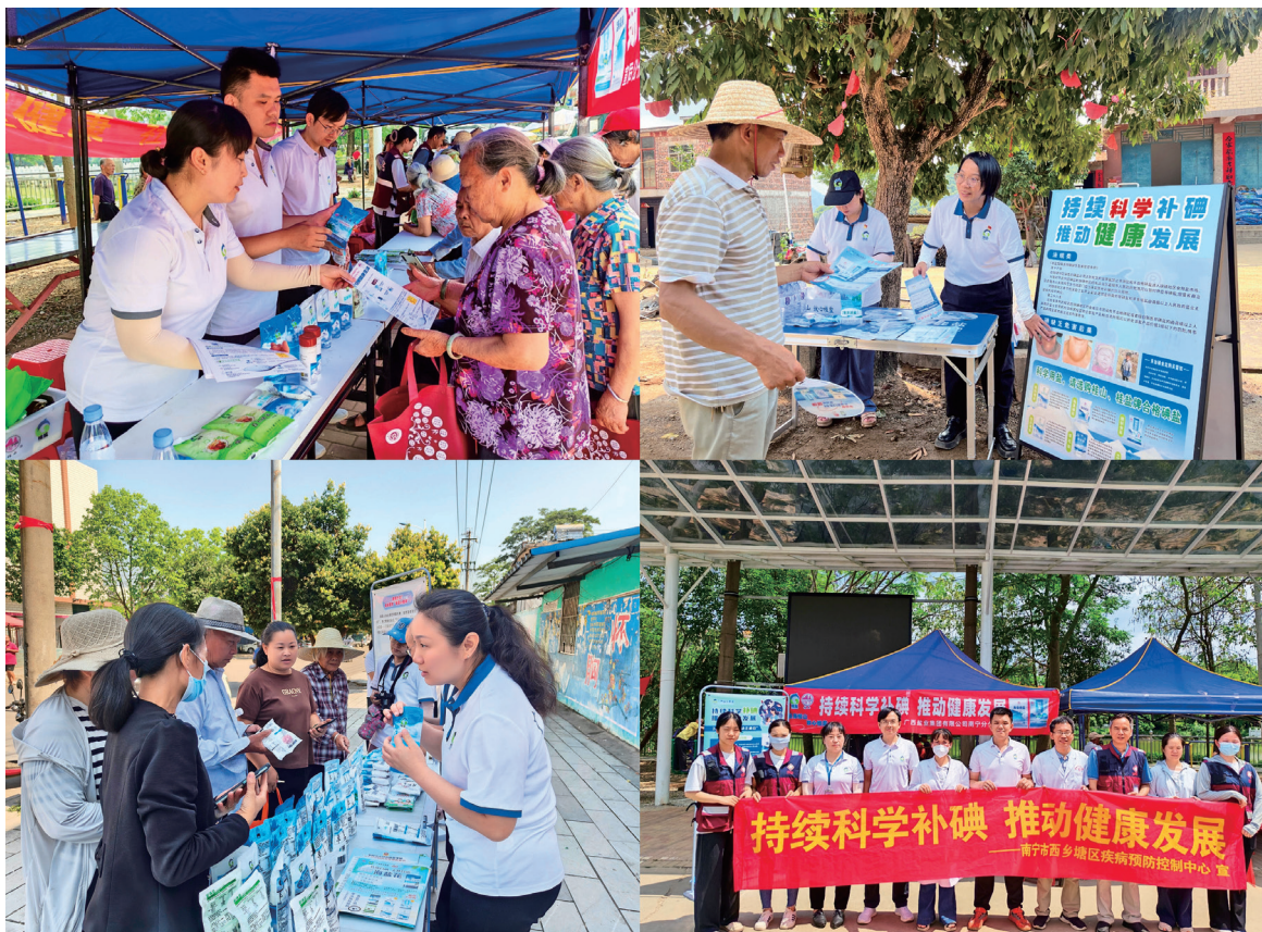
2025 年全国“防治碘缺乏病日”宣传活动