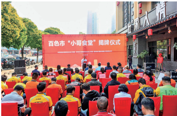
桂林银行联合百色市委社会工作部举行“小哥食堂”揭牌仪式