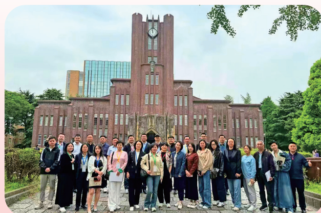
学员们在东京大学合影留念