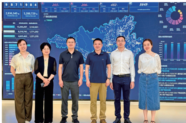
参观“乡见·桂银”展厅

此次调研活动为双方未来的合作奠定了坚实基础。广西企联将继续发挥平台优势，链接会员单位