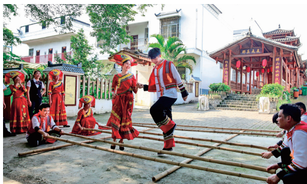
隆安农商银行深入“中国特色村”及“那”文化的故乡——隆安县那桐镇定江村定典屯开展民族节暨金融产品宣传活动

众共居共学、共建共享、共事共乐的社会条件，推进各民族交往交流交融更加广泛深入，在理想、信念、情感、文化上更加团结统一。