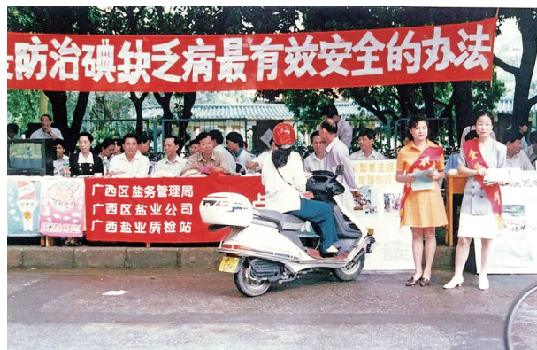
全国“防治碘缺乏病日”主题宣传活动

针对偏远山区和少数民族聚居区的特殊需求，广西盐业集团严格落实国家偏远地区食盐供应保障政策，建立完善食盐责任储备体系和应急供应预案，