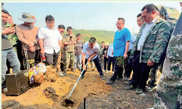
国储林公司开展挖穴施底肥造林工序培训