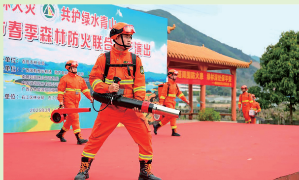
国储林公司安全应急消防队开展森林防火文艺演出