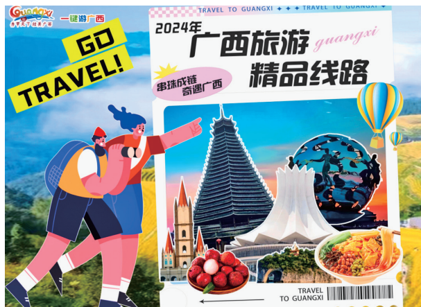
2024年广西旅游精品线路征集活动