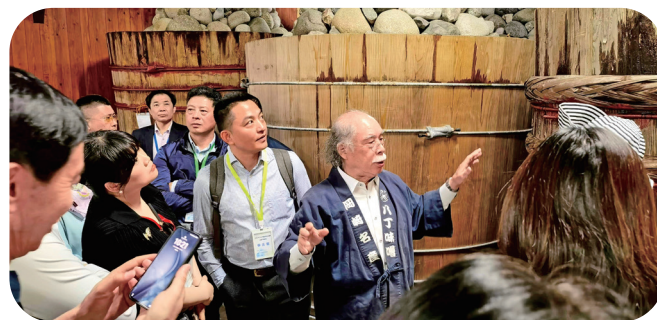
八丁味噌继承人介绍味噌酿造工艺