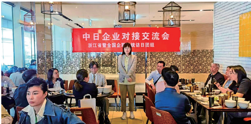
中日企业对接交流会

研修首站学员们来到了松下PHP研究中心、松下资料馆，这座以“Peace and Happiness through Prosperity”（通过繁荣实现和平与幸福）为理念的精神殿堂里，学员们通过《松下幸之助跨越百年的经营之道》的主题讲座，屏息聆听馆长介绍松下幸之助先生的个人和企业成长画卷，讲述他如何通过汇聚众人的见解与智慧，建立了这个繁荣百年的大企业。企业经营不是独舞，而是与时代共鸣的交响，松下幸之助的企业愿景与学员们的雄心壮志悄然共振。