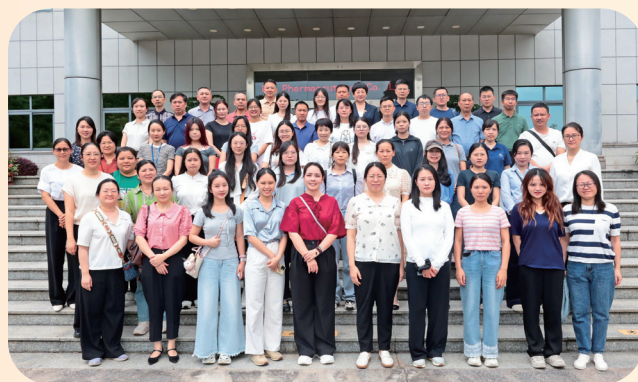
桂林南药股份有限公司合影