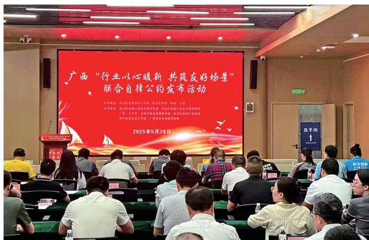
桂林银行参与广西“行业以心暖新 共筑友好场景”联合自律公约发布活动

“三区一体”服务空间（金融服务区、便民服务区、社交互动区）。金融服务区主要配备自助智能设备，提供“夜间延时服务+极简业务流程”；便民服务区主要提供免费饮水机、共享充电宝、应急药箱、微波炉等基础设施；社交互动区主要定期开展反诈培训、“小哥茶话会”等社群活动。以银行网点为支点，创新推出“1+N”服务矩阵，方便居民“就近办、多点办、一次办”。设立服务新就业群体主题银行，联合社区共建健康课堂、数智沙龙、金融讲座，使金融服务嵌