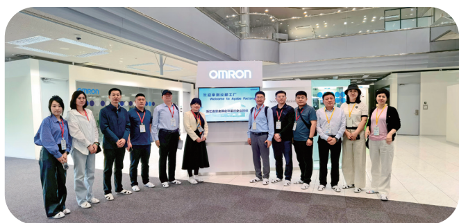
参观欧姆龙绫部工厂