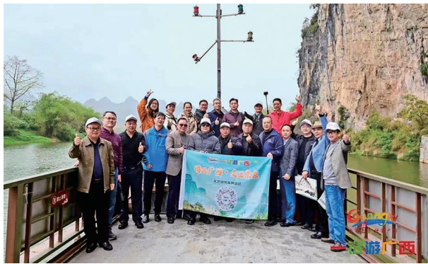
“诗画广西·走进崇左”文艺创作采风活动圆满举行