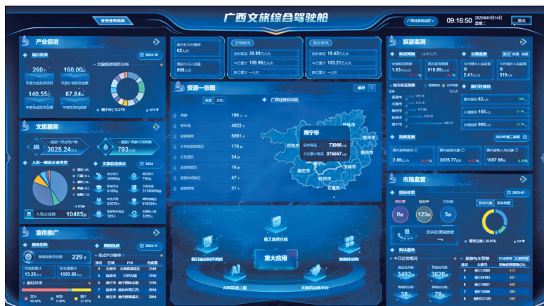
建设智能化桂文旅数据驾驶舱

200 余场，累计发布宣传页、攻略、资讯等 15537 篇，平台累计曝光量超 10 亿次。平台用户足不出户，通过手机即可在“云端”直观感受广西的风土人情和精神文明建设成效，增强了广大群众对中华优秀传统文化的认同感和自豪感，激发群众共同参与文明网络建设的热情，共同筑造美丽、和谐、文明的网络家园。