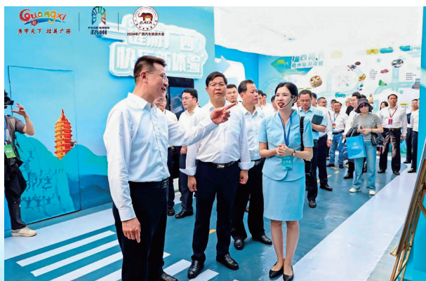
2024年广西汽车旅游大会暨“一键游广西”快乐新体验

以打造新时代网络平台文明风景线为契机，“一键游广西”平台与全区14市、111个县市区形成联动宣传，通过现场直播、活动专题页、资讯发布等方式，定期为用户推送精神文明建设、非遗文化传承、特色文旅活动等主题展示内容，不断铸牢中华民族共同体意识。平台建成以来，共开展了“潮玩三月三·相约游广西”“一键游广西”快乐新体验“广西路书城市主题征集”“云游广西，广西非遗好物介绍”“红色教育基地打卡”“诗画广西系列活动”等宣传活动