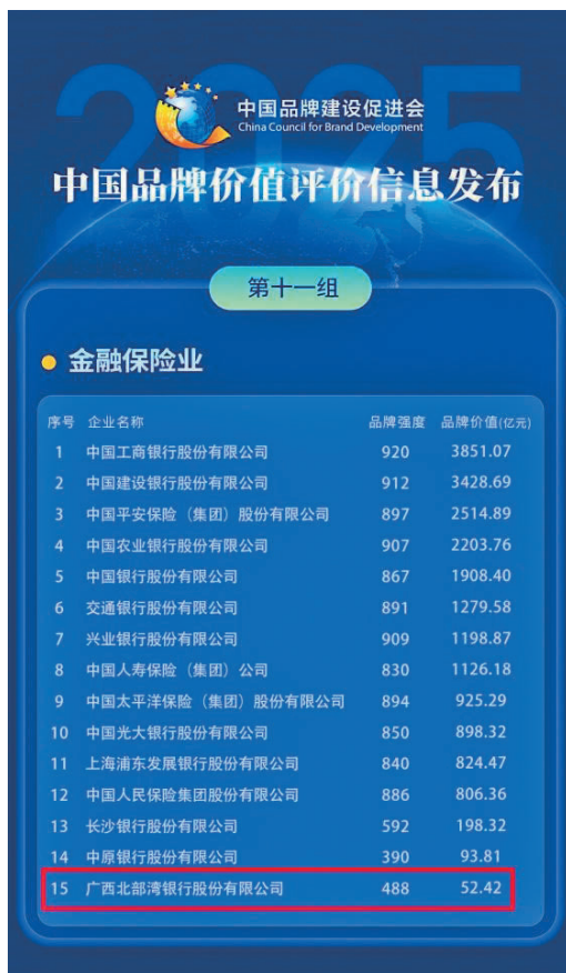
中国品牌价值评价信息榜单

为主线，坚持战略引领、系统推进，将品牌建设贯穿发展各层面、全过程，以内生动力推动品牌价值跃升，不断探索品牌建设的“北行路径”，形成了“品牌价值—社会价值—经济价值”的正向循环。最新年报显示，截至2024年末，北行资产总额5203.71亿元、各项存款余额3842.32亿元、各项贷款余额2965.17亿元，分别同比增长10.45%、11.40%、12.84%。全年实现营业总收入221.12亿元、利润总额36.54亿元、净利润31.12亿元，稳步迈入并站稳中型商业银行行列。主要经营指标连续6年实现两位数增长、资产质量连续6年优于全国全区同业平均水平，主体长期信用等级保持AAA级，在英国《银行家》杂志“全球银行1000强”排名升至第317位，在中国银行业100强排名升至第69位，品牌价值的根基不断夯实。