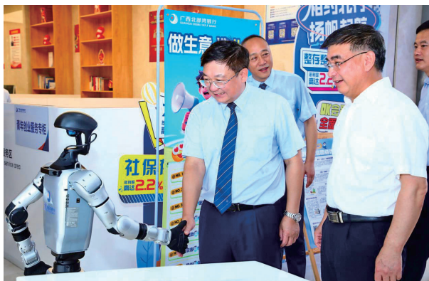
参观五象总部支行

近年来，广西北部湾银行紧跟国家战略部署，积极响应广西经济发展需求，通过强化科技金融工作协调机制、健全金融产品创新迭代链条、精准触达科技领域产业源头，不断激活“科技+金融”要素融合流通，促进创新链、产业链、人才链、资金链深度融合，以实际行动打造金融服务科技发展的新高地。截至目前，广西北部湾银行科技贷款余额287.12亿元，服务科技型企业户数864户，近三年复合增速均超过40%。