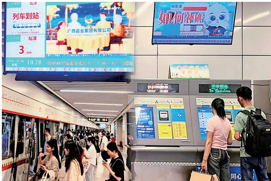
南宁地铁展播食盐科普动画片

在消费升级与科技变革交织的浪潮下，广西盐业集团勇立潮头，紧紧抓住新一轮科技革命和产业变革的时代脉搏，全面推进产业升级，在保障国计民生的同时，培育高质量发展的强劲新动能。