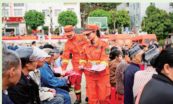
国储林公司安全应急消防队派发防火宣传单

设在林间地头，这是该公司实施“人才兴林”战略的生动缩影。该公司创新“培、考、用”闭环培养模式，深入培养和挖掘人才，2022年以来，围绕智慧林业、营造林管理、林业调查、林木收储以及无人机操作等重点课题开展培训13期，邀请市林业局专家授课3次，外派15名技术骨干赴四川、南宁、柳州、贵港等地“取经”学习，配合推行“凡进必考、以考定岗”制度，让人才成长轨迹清晰可见。