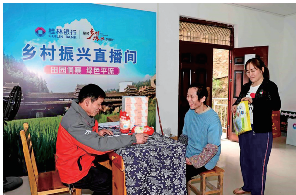
桂林银行工作人员为村民登记积分、兑换产品

德积分”“党员奉献积分制”等各项农村治理机制中，在贷款额度、利率上给予优惠政策，引导群众重义守信、崇德向善，强化乡村金融文化培育；桂林银行柳州三江支行通过“积分+信用+金融”的创新模式，将村民文明行为、志愿服务、环境保护等积极行动与金融信用相结合，把“文明积分”转化成个人、家庭的信贷授信依据之一，激发村民共建美丽乡村的积极性，并借助“积分超市”平台，开展金融知识普及活动，向村民宣传金融产品、防诈骗知识等，提升村民的金融素养，共支持了三江3个乡镇6个行政村“积分超市”建设，受益群众约3.5万人。