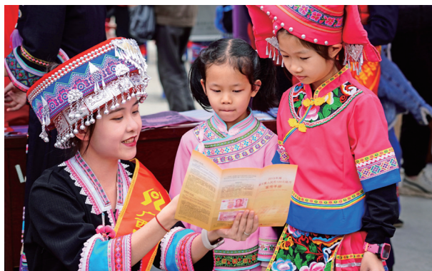
田林农商银行工作人员在壮族“销正月”民俗活动期间向少数民族少年宣讲金融知识

进一步发挥了地方金融主力军作用。作为广西落实惠农政策的重要窗口和政府与农民之间最紧密的金融纽带，广西农商联合银行始终把政治性和人民性放在金融工作的首位，积极履行地方银行使命