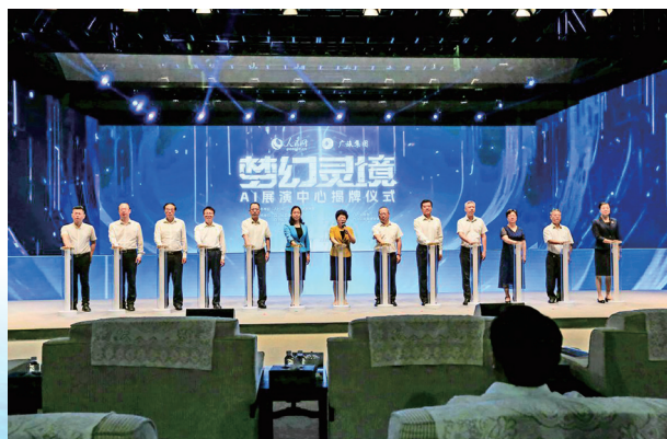
“梦幻灵境”AI 展演中心揭牌仪式

从行业标准化管理到智慧监管、智慧服务、智慧营销的完整应用闭环，为广西旅游产业发展、假日经济运行分析等工作提供数据决策支撑。打造系列文旅重大应用场景。建成“全区假日旅游指挥调度平台”“阳朔遇龙河筏工监管在线”“广西文旅新媒体宣传矩阵”“文旅供应链平台”“AI 智慧旅游定制”等 5 个应用场景，夯实广西文旅产业数字化服务治理体系。推进“一键游广西”数智业务中台建设，打通智游宝、票付通、鼎游、天同同城、西软、罗盘、绿云、订单来了等主流景区、酒店管理系统，与携程、美团、飞猪、同程、智桂通等平台实现旅游产品资