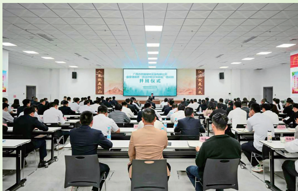
国储林公司“营林数字化转型培训班”开班仪式