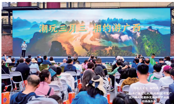
2024年“潮玩三月三 相约游广西”文化旅游（成都）宣传推广