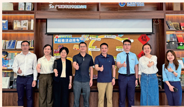
调研特色网点南宁桂雅路小微支行