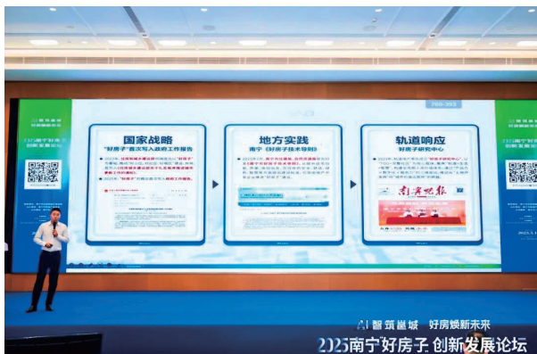
2025 南宁好房子创新发展论坛现场

年率先成立“好房子研究中心”，以“TOD+ 完整社区”为核心载体，聚焦“轨道+生态+智慧”，构建全周期人居价值体系，通过“产品力 x 数字化 x 服务力”的三维驱动，推动从“土地开发商”向“城市价值运营商”的跨越。