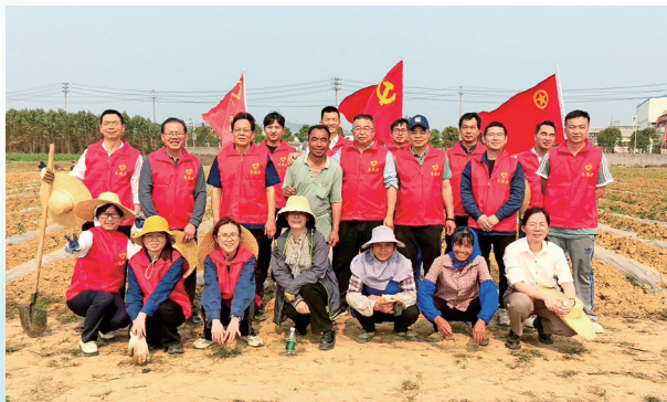
企农一条心 锚定目标加油干