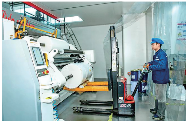
桂盐包材公司推动智能设备迭代更新