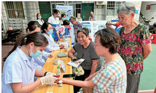
广旅养老公司党支部、广旅健管公司党支部联合开展志愿服务活动

今年是圆满做好“十四五”规划收官工作，认真谋划“十五五”规划目标任务的关键一年，大健康集团党委准确把握面临的形势和任务，审时度势、与时俱进，不断优化工作策略和方法，引导全