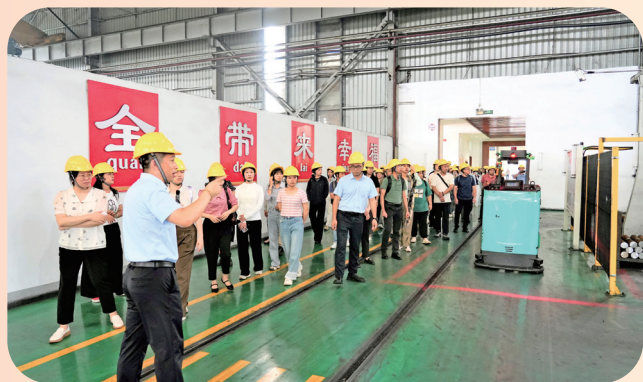
参观桂林福达智能工厂