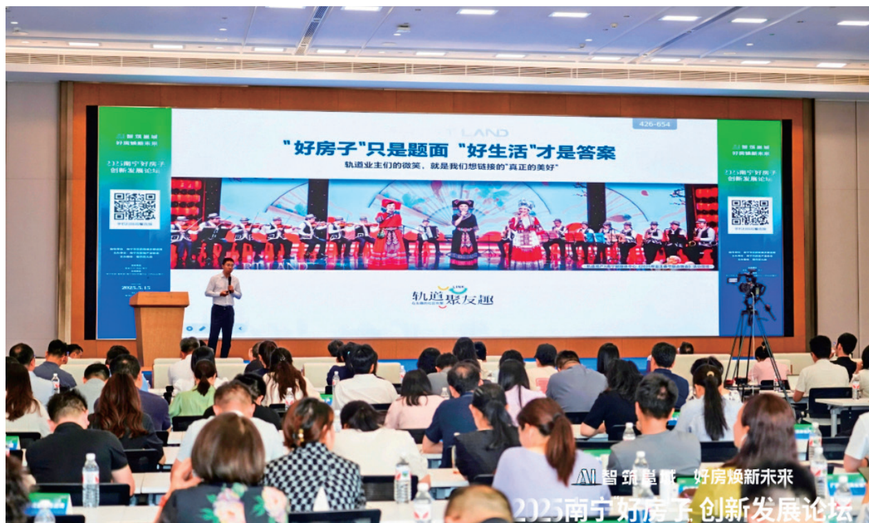
2025 南宁好房子创新发展论坛现场