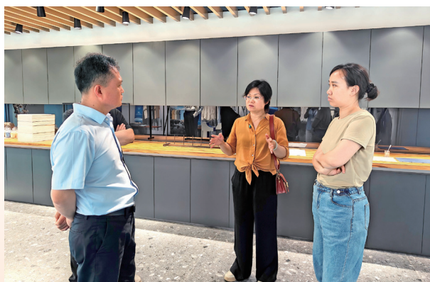
考察组认真了解企业可持续发展理念

5月21日，考察组走进溢达集团打造的可持续发展园林——十如园区。这座占地 800 亩的园区以“虽为人作，宛如天开”为理念，融合了纺织服装创新与 ESG（环境、社会、治理）实践。考察团通过参观展厅、生产车间及厂区环境等，了解到溢达集团如何在全球供应链格局中，以可持续创新不断转