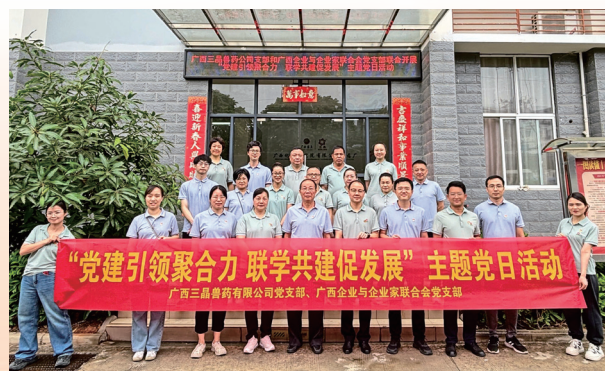
广西企业与企业家协会联合会党支部与广西三晶兽药公司党支部联合开展“党建引领聚合力 联建赋能促发展”主题党日活动