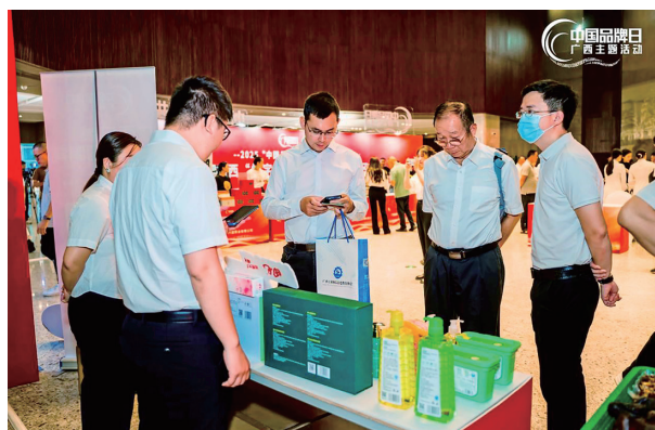
观看企业品牌产品

5月8日，以“桂品潮涌 品牌赋能新消费”为主题的“2025 中国品牌日”广西主题活动在南宁举行，区内多家行业协会、品牌企业的负责人和代表超600多人参会。现场举行“2025 广西品牌共建生态圈”启动仪式，与会嘉宾分别围绕“广西特色农产品品牌高质量发展的创新之道”“加强标准化建设打造广西品牌航母”等内容发表主旨演讲，共同为