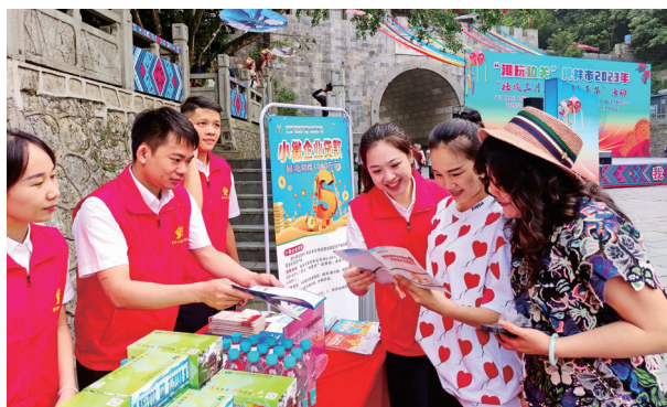
凭祥农商银行开展“广西三月三”建设铸牢中华民族共同体意识主题实践系列活动

为深入贯彻落实党中央和自治区党委决策部署，广西农商联合银行充分发挥主体作用，通过“五个持续”在全系统中开展“共建五个家园·融惠千家万户”行动，率先在全国创新培育打造100家“铸牢中华民族共同体意识红石榴网点”，加大对12个和3个享受少数民族自治县政策的少数民族地区加大信贷支持力度，以实际行动助力示范区建设，助