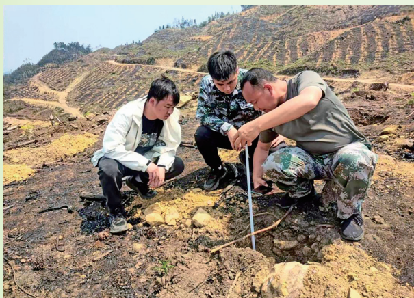
国储林公司党员先锋队带头进入林地测量验收挖坑深度

预防森林火灾，核心在于管住“火源”，更在于唤醒每个人的责任意识，进入三月，正值广西“三月三”和清明假期，做好森林防灭火工作至关重要。国储林公司联合市林业局、百林林场等8家单位组