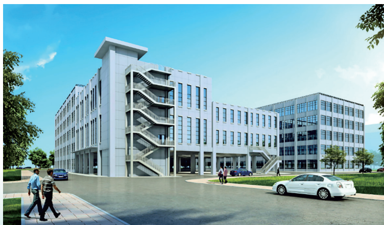
广西壮族自治区医疗器械检测中心电磁兼容续建项目效果图

该项目位于南宁市江南区国凯大道东19号金凯工业园内，占地面积673.15平方米，建筑面积2040.29平方米，拟续建1栋两层电磁兼容实验室，首层为架空停车，二层为10米法电磁兼容实验室以及配套辅助用房，建筑高度为19.5米，架空停车位为16个，设置一部电梯。项目计划在2025年底前建成使用。