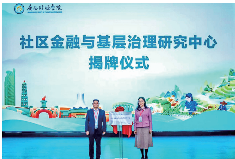
桂林银行成立“社区金融与基层治理研究中心”

社区金融的暖心服务窗口创新，本质是通过空间再造重构金融机构的社会角色。当冰冷的 ATM 机旁出现温暖的饮水机，当标准化的服务流程融入人性化的社工理念，普惠金融才能真正抵达“最后一米”，实现经济效益与社会价值的共生共荣。社区金融暖心窗口的实践表明，通过空