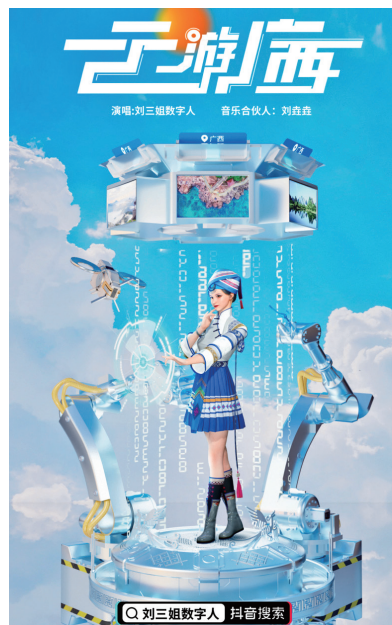
刘三姐数字人文旅大模型建设上线

建设智能化桂文旅数据驾驶舱，运用大数据技术和数字化手段，多部门跨部门整合数据，聚焦于文旅数据整合共享与业务协同应用两大核心，建立文旅领域基础资源、行业监管、公共服务、经济运行等四大文旅主题数据库，全面汇聚自治区文化旅游数据资源，累计归集数据量 11.87 亿条，构建起