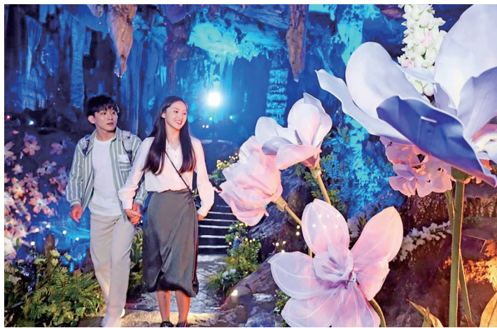
成功打造沉浸式溶洞元宇宙演艺项目

助力开展文旅优惠活动。2022年协助自治区文旅厅累计发放消费券共1000万元，直接带动消费7160万元；2023年助力“秋冬/春游广西”景区门票优惠和酒店住宿优惠活动，完成交易金额约5288万元，服务游客累计约132万人次。打造“梦幻灵境”AI展演中心。与人民网联合实施打造“梦幻灵境”AI展演项目，主要展示AI体验剧《白泽的奇幻旅程》，该剧目将科技与音乐、戏剧、舞蹈、传统文化等多种元素深度融合，为现场观众带来沉浸式的观赏体验，持续以展示人工智能前沿成果为核心，打造成为面向广大青少年、市民游客和企事业单位的科技素养体验馆、新型消费打卡地、科