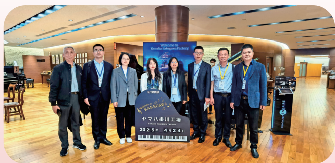
参观雅马哈挂川工厂