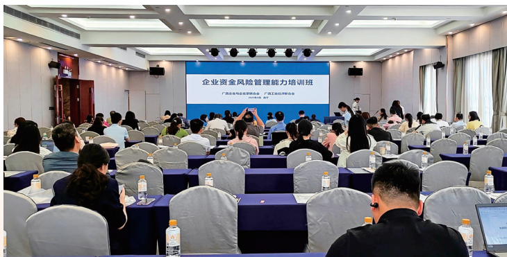
广西企业与企业家联合会、广西工业经济联合会在南宁市举办企业资金风险管理能力培训班

在当前复杂多变的经济形势下，企业面临的资金流动性风险、债务压力等问题日益凸显。为帮助企业强化风险意识、完善管理机制，广西企业与企业家联合会精准对接企业需求，4月