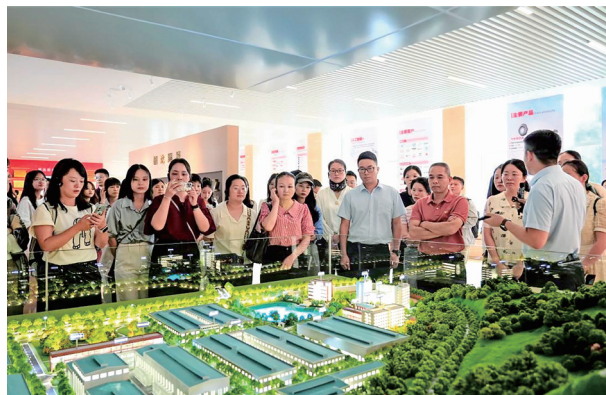
参观桂林福达展厅