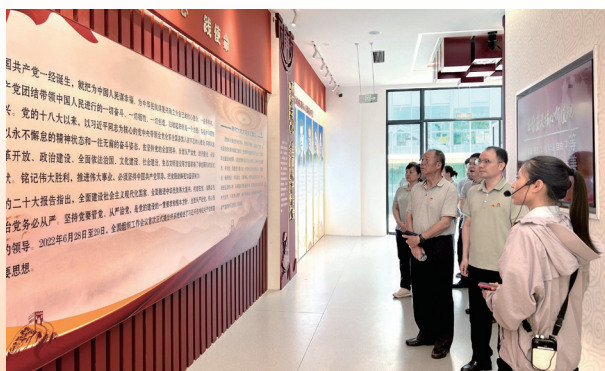
广西企业与企业家协会联合会党支部在明阳农场廉洁文化教育馆开展廉洁教育学习