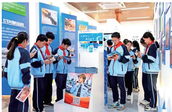
柳州食盐科普阵地

普及科学补碘知识，是防治碘缺乏病工作的关键一环。在 2025 年全国“防治碘缺乏病日”宣传活