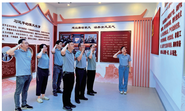
广西企业与企业家协会联合会党支部全体党员重温入党誓词