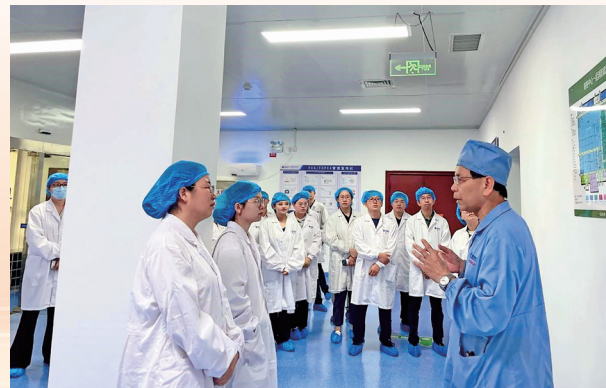
参观桂林南药生产车间