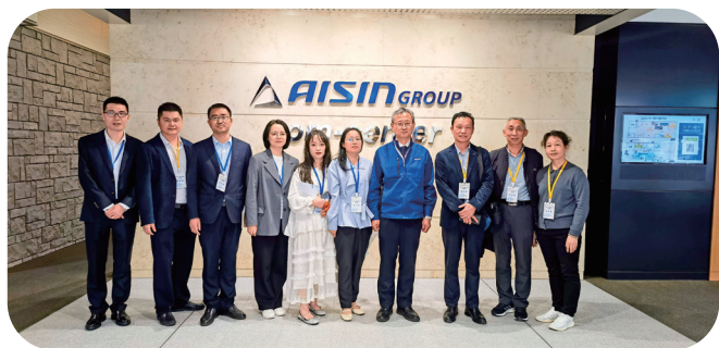
学员们在爱信精机合影