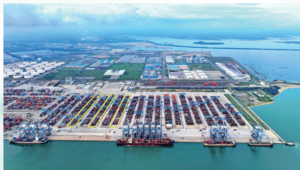
自动化码头“U”型标注图

现有的 9 号 10 号泊位将扩建升级为 2 个 20 万吨级的集装箱泊位，可以同时停靠两艘全球最大集装箱船，