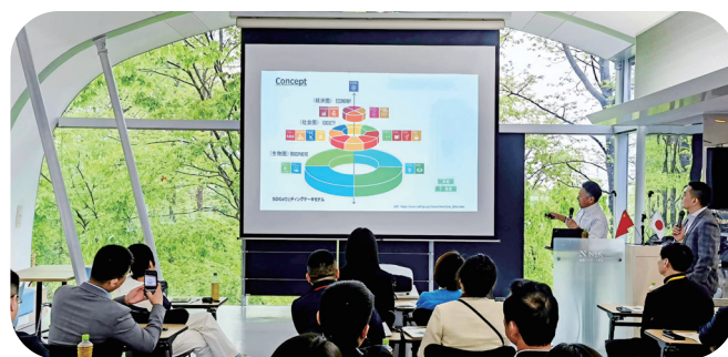
锅屋株式会社宣讲