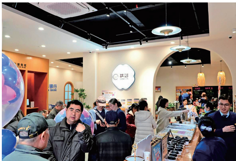
桂林银行在南宁东盟商务区打造咖啡主题网点

间重塑、服务融合与制度创新，金融机构不仅能拓展市场边界，更能成为社会治理的积极建构者。这种“有温度的普惠”，正是当今高质量发展时代金融向善的最佳“注解”。