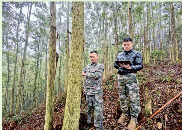
国储林公司林调人员测量林木胸径

建森林消防宣传联盟，组织开展“守护绿水青山，共筑防火屏障”森林消防主题宣传月活动，深入右江区、那坡县等5个重点林区村屯开展巡回宣教。