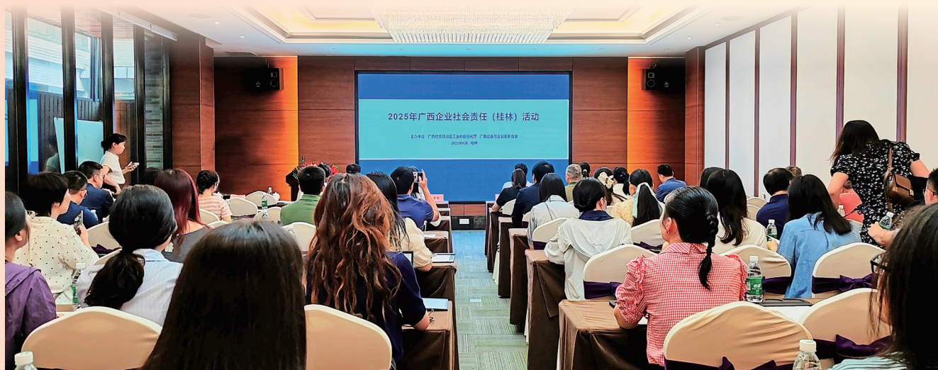
2025年广西企业社会责任(桂林)活动现场