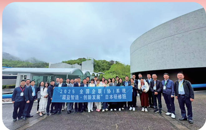
2025 全国企联（协）系统“精益制造·创新发展”日本研修班