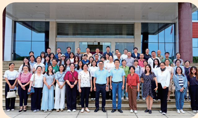
桂林福达股份有限公司合影