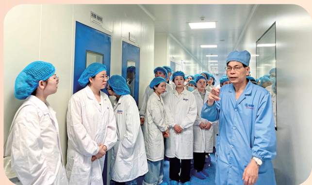
参观桂林南药生产车间