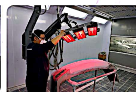
苏舜“绿色”喷涂喷出亮丽色彩