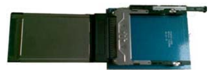
延伸卡套 ( 选项 )