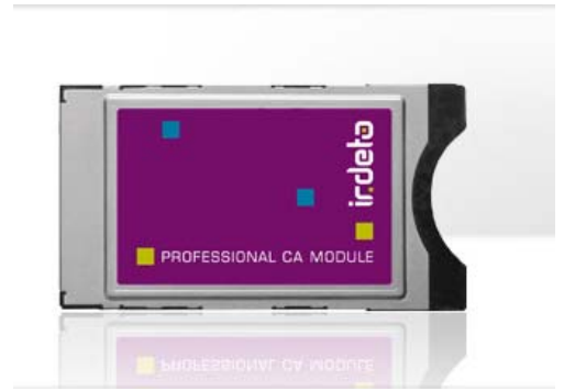
纽拉特科技CAM卡正面（带irdeto标志）