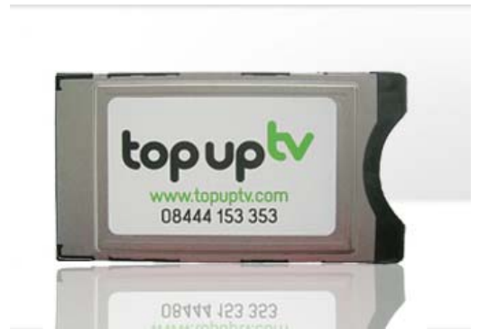
纽拉特科技CAM卡正面（带topuptv标志）