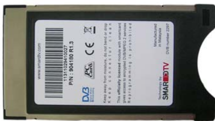
纽拉特科技CAM卡背面（带SMARTV标志）