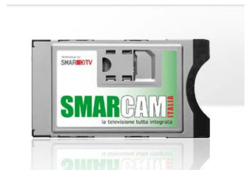
纽拉特科技CAM卡正面(意大利标准)