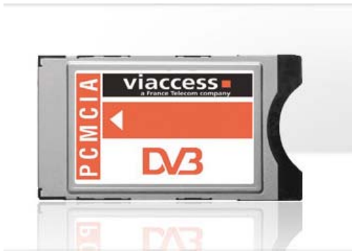
纽拉特科技CAM卡正面（带viaccess标志）