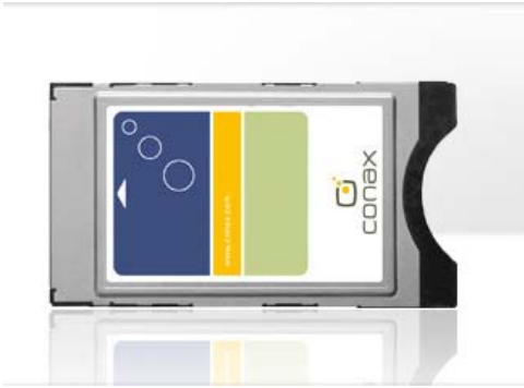
纽拉特科技CAM卡正面（带conax标志）