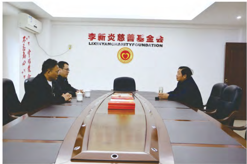
龙岩凤凰小学 (解放路校区)校领 导到基金会交流座谈