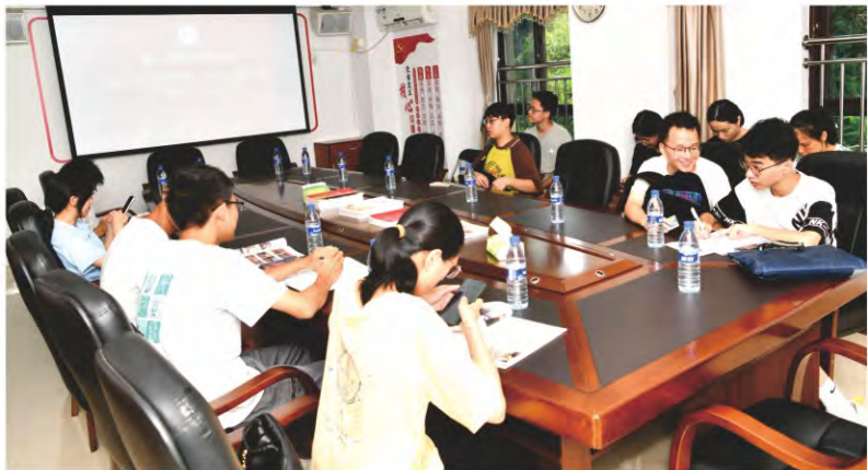
基金会“千人培养计划”项目2024级 大学生座谈会