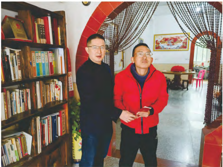
与龙岩市侨办联合开展春节慰问困难职工