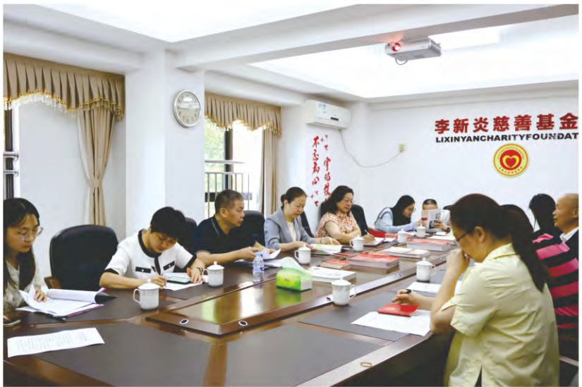
龙岩市人大 《慈善法》执法检 查小组深入基金会 指导工作