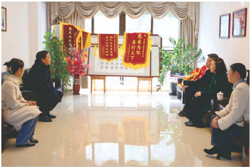
龙岩学院学工 部领导到基金会交 流座谈