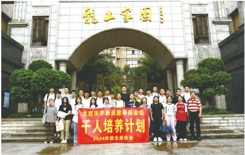
基金会“千人培养计划”项目 2024级大学生合影

基金会成立以来便致力于开展利民公益项目，让广大民众受益，是资助项目中捐资总额最多的一项。多年来，基金会为社会公益事业持续捐资，帮助城乡医院添置医疗设备，资助农村修建文体活动中心，改善教学条件、设施，支持地方教育事业等，取得较为显著的社会效益。截止2024年，利民公益项目已向社会各界捐资超9772.6489万元，开展项目107项。