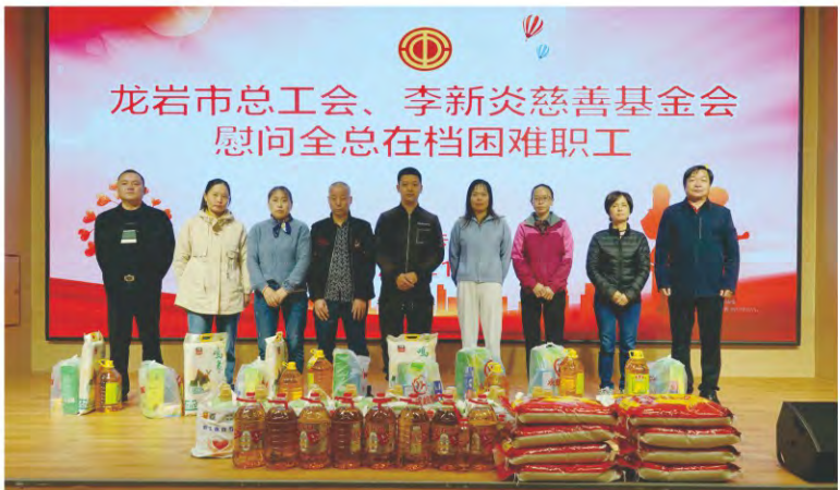
与龙岩市总工会联合开展慰问困难职工