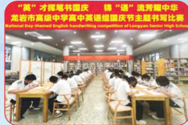
“英”才挥笔书盛庆 锦“鲤”跃海耀中华 龙岩市高级中学高中英语组国庆节主题书写比赛 National Day-themed English handwriting competition of Longyan Senior High School