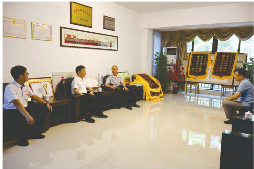
龙岩市高级中 学领导到基金会交 流座谈