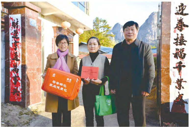
与龙岩市妇联联合开展“关爱困难母亲”走访慰问活动