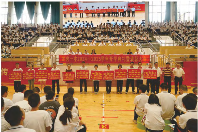
基金会派员参加龙岩一中学生开学典礼暨表彰大会