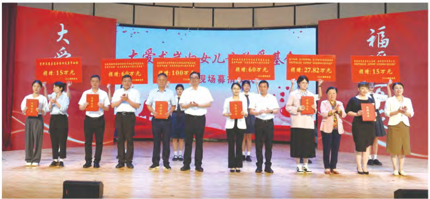
基金会派员 参加龙岩市妇联 举办的大爱龙岩 妇女儿童风采基 金现场募捐仪式