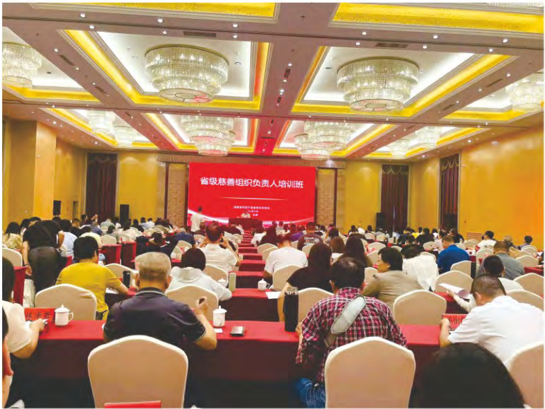
基金会派员参加省级慈善组织负责人培训班