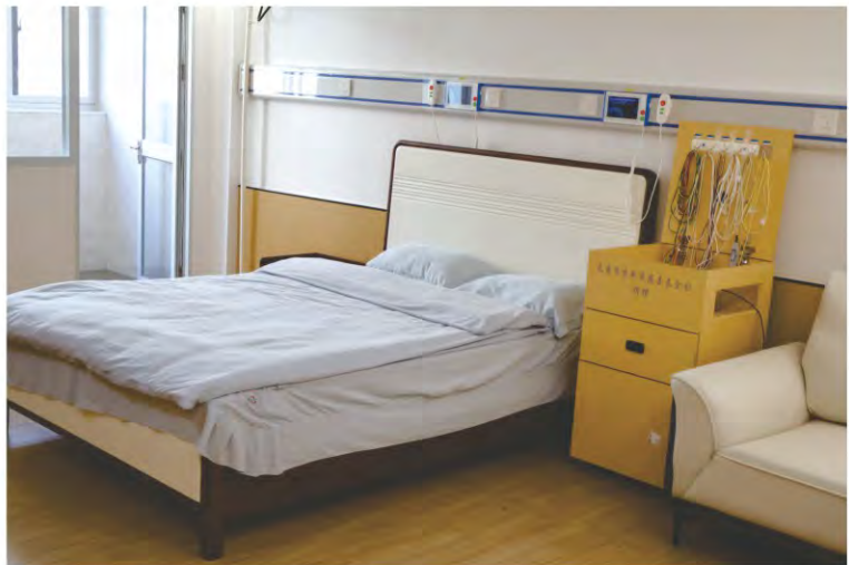
基金会捐助龙岩市第三医院购置多导睡眠仪投入使用。