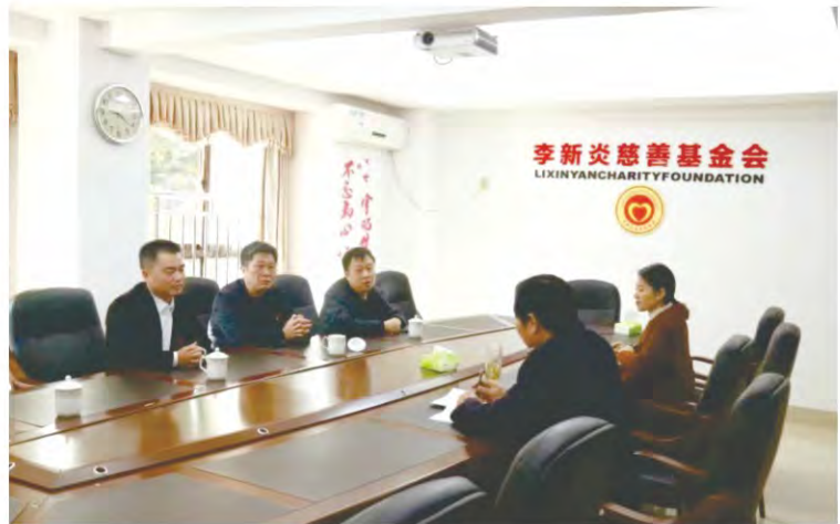
龙岩市第三医 院领导到基金会交 流座谈