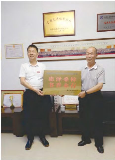
基金会理事长接收龙岩高级中学赠送的牌匾