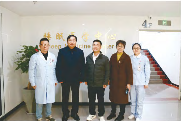
基金会理事走访龙岩市第三医院社会心理服务中心