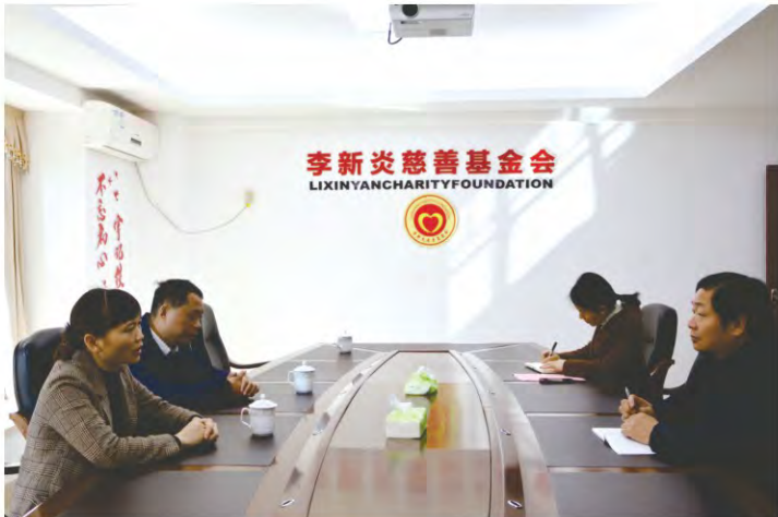
龙岩市中医院领 导到基金会交流座谈